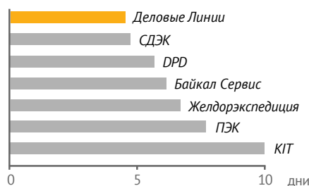
Итоговый рейтинг российских операторов по скорости доставки из Москвы и Санкт-Петербурга (РБК Исследования рынков, декабрь 2023)